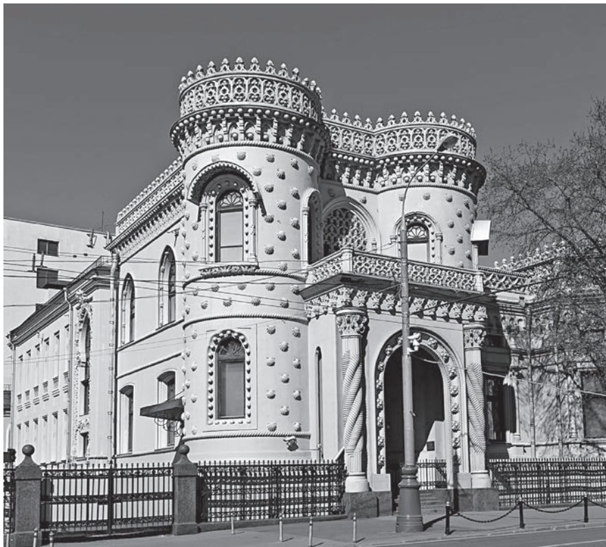
Особняк Арсения Морозова, ныне Дом приемов Правительства РФ (ул. Воздвиженка, д. 16). Современная фотография

преданию, эта земля была подарена митрополиту Московскому Алексию, который в 1357 г. ездил в Орду по приглашению хана Джанибека для исцеления от слепоты ордынской царицы Тайдулы 11 .